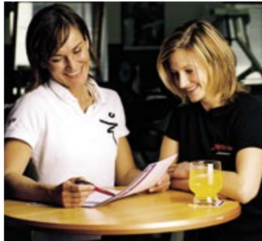
Mit der Trainerin die Ziele abstecken

Dem Prinzip der steigenden Belastung zufolge ist es einem Fitnesssportler, der zum augenblicklichen Zeitpunkt beispielsweise zehn Wiederholungen mit 20 kg Gewicht in der Kniebeuge schafft, aufgrund der Superkompensation im nächsten Training möglich, elf Wiederholungen zu schaffen. Wenn das nächste Training am höchsten Punkt der Anpassung erfolgt - und das ist entscheidend -, erzielt der Sportler seine Leistungssteigerung um eine Wiederholung, nicht weil er