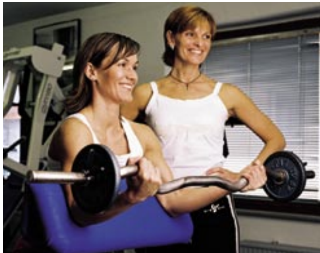
Trainingsbelastung muss richtig dosiert sein

Mehr Eigenverantwortlichkeit und Selbstbestimmtheit in Sachen Fitness und Gesundheit – das ist eines der wesentlichen Ziele des Trainerkonzeptes.