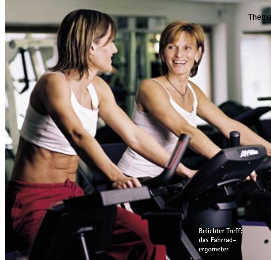
Beliebter Treff: das Fahrrad- ergometer