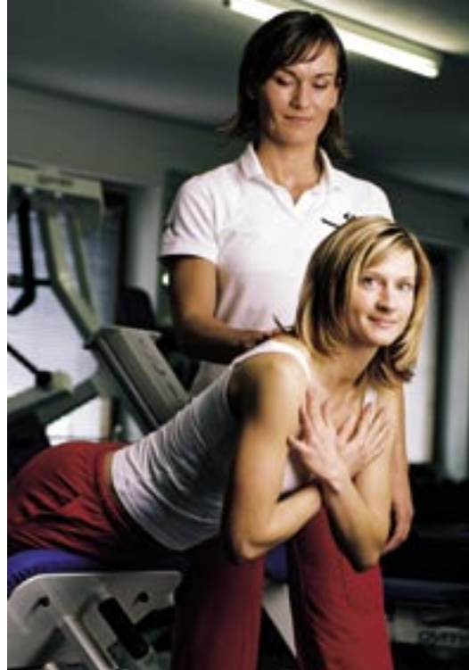
Ein starker Rücken kennt keinen Schmerz

Jede einzelne dieser Fragen ist nur zu klären, wenn der Kunde ein Trainingsprotokoll führt. Ein Training ohne Trainingsprotokoll erlaubt dem Trainer einzig und allein Aussagen über die Qualität der Übungsausführung, aber keinerlei Aussagen über die Entwicklung der Leistungsfähigkeit. Wer sein Training nicht auf einem Trainingsplan protokolliert, hebt im wahrsten Sinne des Wortes planlos Gewichte und fährt planlos Fahrrad. Denn Training ist ein planvoller Prozess, der auf sportwissenschaftlichen Erkenntnissen beruht, deren praktische Umsetzung auf einem Trainingsplan dokumentiert wird. Damit ist der Prozentsatz an Mitgliedern, die langfristig einen Trainingsplan (-protokoll) führen, ein sicherer Hinweis auf einen hohen Informationsstand der Kunden und eine gute Mitgliederbetreuung. Trainerkonzept-Fitnessclubs zeichnen sich dadurch aus, dass zwischen 70 und 90 Prozent der Kunden ihr Training auf einem Trainingsplan protokollieren und auf diese Weise ihren Trainingserfolg schwarz auf weiß dokumentieren. (70 bis 90 Prozent